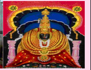
श्री तुळजाभवानी, तुळजापूर