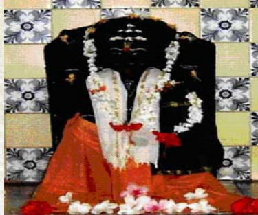
श्री लक्ष्मी नृसिंह, कसबा संगमेश्वर