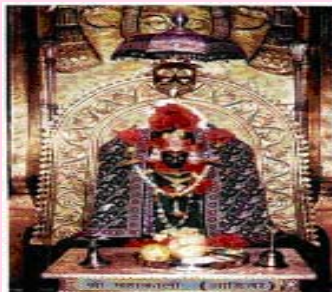
श्री महाकाली, आडिवरे