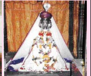
श्री कोळेश्वर, कोळीसरे