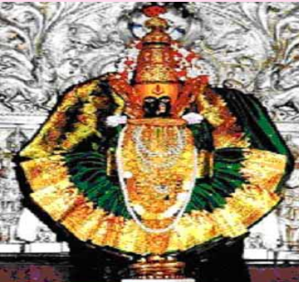
श्री महालक्ष्मी, कोल्हापूर