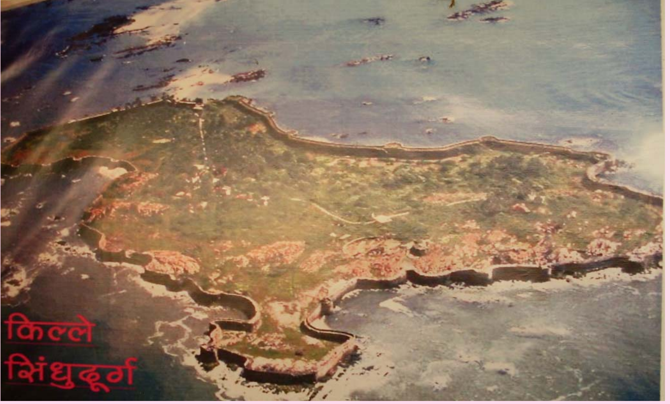
स्थळ: मालवण, कुरटे बेट, सिंधुदूर्ग किल्ल्याचा नकाशा,