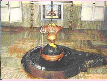
श्री व्याडेश्वर, गुहागर