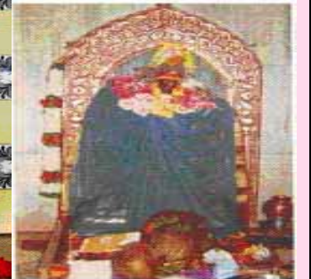
श्री दुर्गा, मुरुड