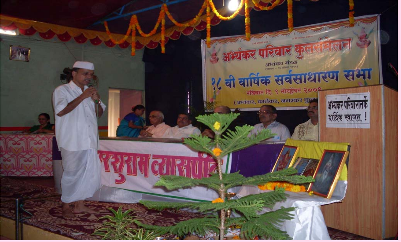
अभ्यंकर परिवाराच्या १८ व्या वार्षिक स्नेहसंमेलना प्रसंगी मंत्र पठन करीत असतांना